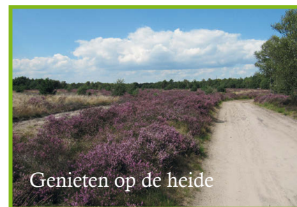
Genieten op de heide